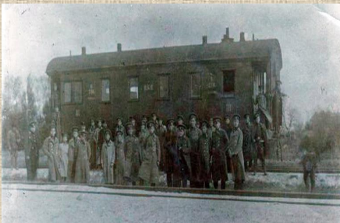
Відправка з Києва

продовжувались не більше тижня, до 26 січня. Звісно, про жодну адекватну військову підготовку не могло йти і мови. У той же день загін підпорядковується Аверкію Гончаренку, переправляється під Бахмач, де разом з чотирма сотнями курсантів 1-ї Київської юнкерської школи імені Богдана Хмельницького має стати на захист Києва.